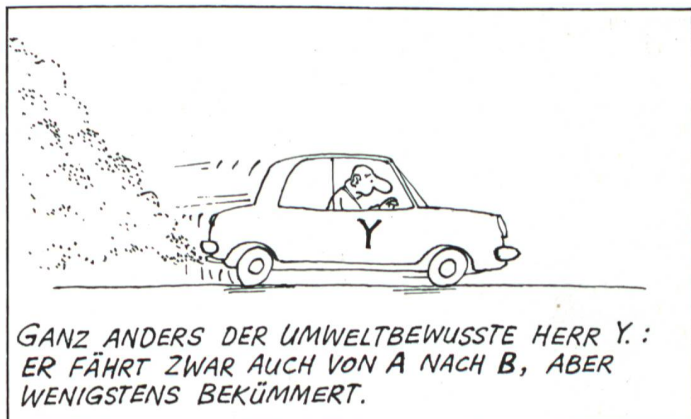
GANZ ANDERS DER UMWELTBEWUSSTE HERR Y.: ER FÄHRT ZWAR AUCH VON A NACH B, ABER WENIGSTENS BEKÜMMERT.

Der Gasverbund Mittelland bestellte beim Einsiedler Carosserieunternehmen Koch eine Vorserie von 50 Fahrzeugen, von denen etwa 35 derzeit Testkilometer abspulen. Ab 2004 soll das saubere Gefährt im Smart Center Bern erhältlich sein, eventuell auch in weiteren. Der Preis liegt mit 20 000 Franken rund 4000 Franken über jenem für den Smart Pulse . Aktuell gibt es im Mittelland etwa 25 Erdgastankstellen, bald sollen es mehr sein.