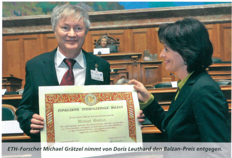
ETH-Forscher Michael Grätzel nimmt von Doris Leuthard den Balzan-Preis entgegen.

Vier Persönlichkeiten aus Kultur und Wissenschaft konnten am 20. November in Bern den renommierten Balzan-Preis entgegennehmen. Darunter befand sich auch der Lausanner ETH-Forscher Michael Grätzel, der für seine Entdeckung im Bereich der Solarzellen geehrt wurde. Überreicht wurden die Preise von Bundesrätin Doris Leuthard. Grätzel erhielt den Preis in der Kategorie Materialwissenschaften. Der Wissenschaftler wurde damit ausgezeichnet für seine zahlreichen Beiträge zu den Materialwissenschaften und im Besonderen für seine Erfindung und Entwicklung eines neuen Typs von Photovoltaik-Solarzellen, der «Dye Sensitized Cell», besser bekannt als Grätzel-Zelle, wie die Balzan-Stiftung mitteilte. Die diesjährigen vier Balzan Preise betragen je eine Million Schweizer Franken, wovon die Preisträger die Hälfte in Projekte investieren müssen, welche der Förderung des wissenschaftlichen Nachwuchses dienen. Die 1956 gegründete internationale Balzan-Stiftung fördert weltweit die Kultur und Wissenschaften sowie verdienstvolle Initiativen für Frieden und