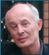
H. J. Schellnhuber Direktor des Potsdam-Institut für Klimafolgenforschung (PIK)

Mittwoch, 20. Oktober 2010 Congress Hotel Seepark in Thun