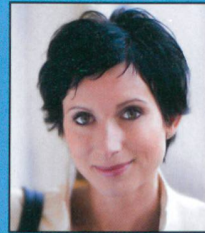
P. Bruderer Wyss Nationalratspräsidentin und Unternehmerin