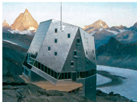
Kleines Bild: Architektonisches und ökologisches Juwel – die neue Monte-Rosa-Hütte.