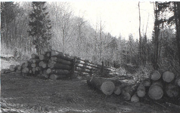
En Suisse, le bois représente la principale énergie renouvelable avec la force hydraulique.

(Extrait de la réponse du Conseil fédéral du 19 février 1997).