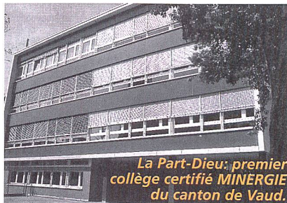
La Part-Dieu: premier collège certifié MINERGIE du canton de Vaud.