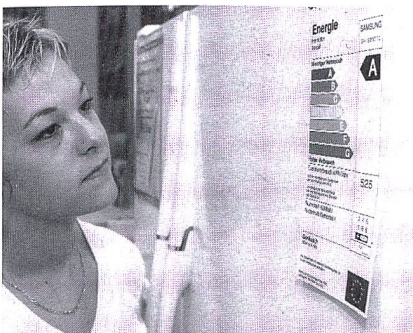
Etiquette pour appareils ménagers

Avantages. L'étiquette Energie indique la consommation de carburant en l/100 km, l'émission de CO 2 en g/km, ainsi que la consommation relative. Elle encourage l'auto-