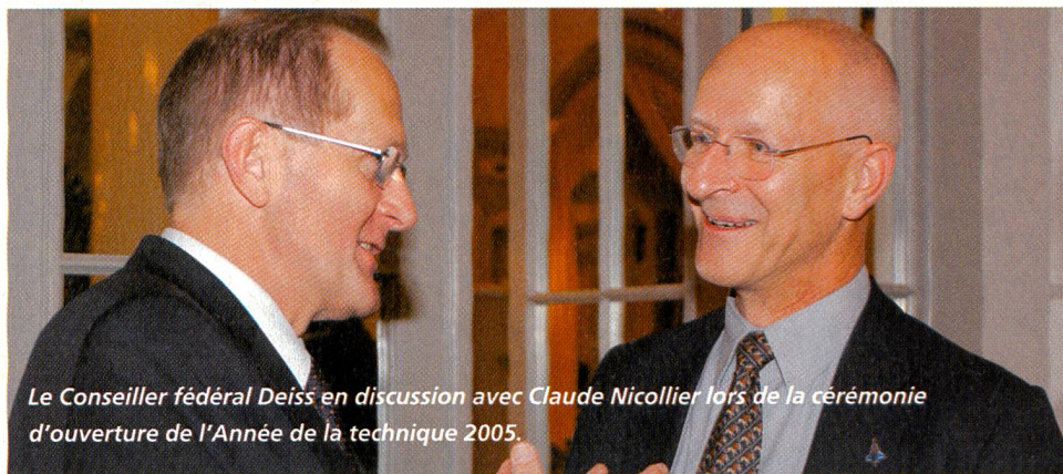
Le Conseiller fédéral Deiss en discussion avec Claude Nicollier lors de la cérémonie d'ouverture de l'Année de la technique 2005.

Contact: Année de la Technique c/o Swiss Engineering UTS 37, bd de Grancy, 1006 Lausanne Tél. 021 617 79 79 info.sr@swissengineering.ch www.annee-de-la-technique.ch