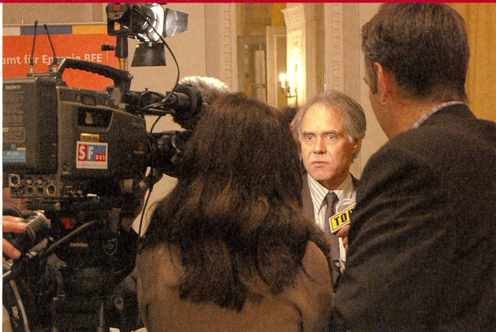
Dans son année présidentielle, le Ministre de l'énergie, M. Moritz Leuenberger, s'engagera pour une politique énergétique durable.

dans cette voie. En passant des conventions avec des partenaires tels que la branche de l'automobile ou l'industrie du ciment, nous pouvons obtenir une réduction des rejets de CO 2 sans contrainte. L'automne dernier, le Conseil national a clairement manifesté sa volonté de promouvoir les énergies renouvelables lors des discussions sur l'approvision-