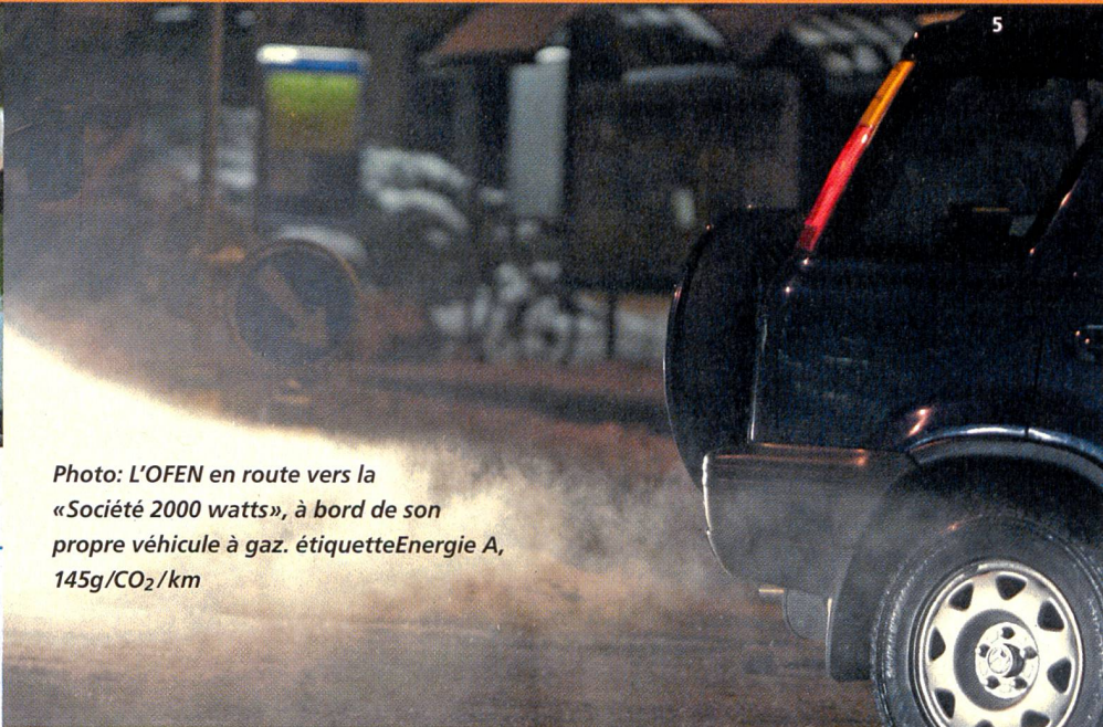
Photo: L'OFEN en route vers la «Société 2000 watts», à bord de son propre véhicule à gaz. étiquetteEnergie A, 145g/CO 2 /km

La même étude révèle, qu'à partir de 2020, les carburants biogènes seront concurrentiels et aussi rentable que les carburants fossiles (cf. graphique).