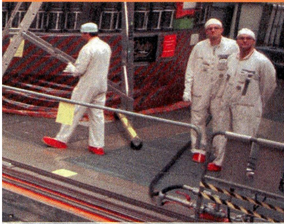
Halle du réacteur de Leibstadt avec la piscine et le dispositif mécanique de transfert.