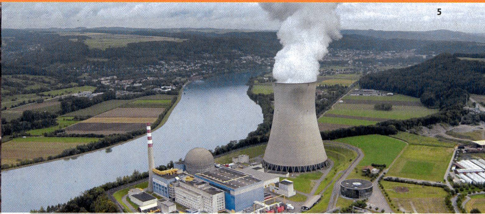
La Suisse débat de l'avenir de l'énergie nucléaire. En photo l'usine de Leibstadt.