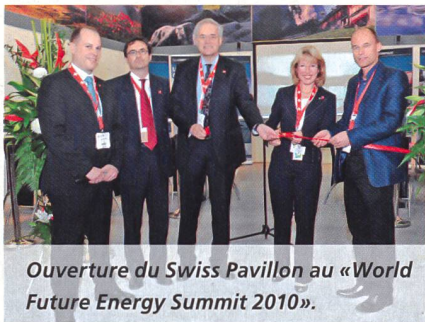
Ouverture du Swiss Pavillon au «World Future Energy Summit 2010».