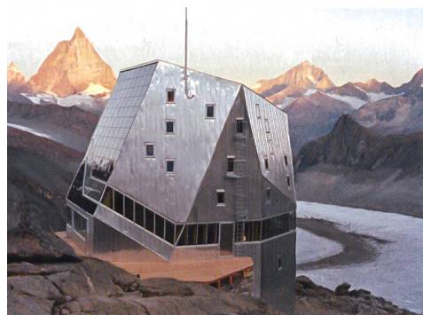
La nouvelle cabane du Mont Rose avec le Cervin en arrière-plan.