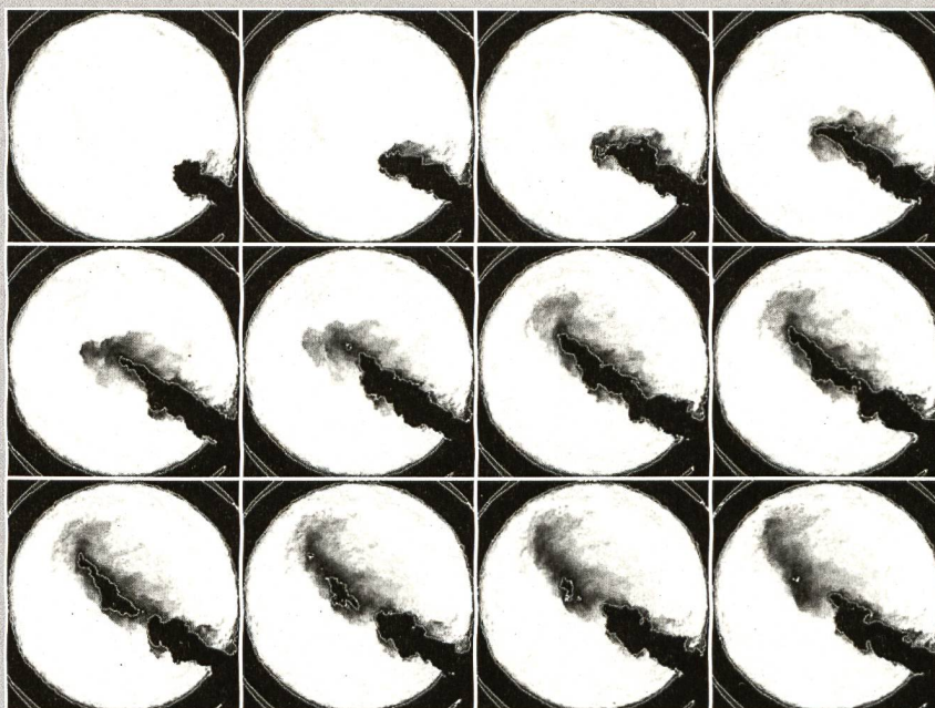
Visualisation du jet de diesel à l'intérieur de l'installation d'essai à des conditions de 90 bars et 930 kelvin.