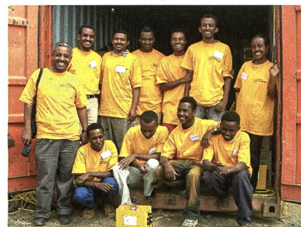
Collaborateurs éthiopiens de la fondation Solarenergie.

Le photovoltaïque est une source intéressante de courant pour l'éclairage et la production d'eau potable. De petites centrales hydrauliques ou les technologies de la biomasse peuvent en revanche s'avérer plus adéquates pour faire face à des besoins plus importants. Selon le site, l'énergie éolienne peut représenter une option compétitive et performante. Les énergies renouvelables ont toutes en commun – surtout pour les applications domestiques – de ne générer presque aucun coût courant. Les frais d'achat comparativement élevés requièrent toutefois de nouveaux modèles de financement novateurs. Selon le rap-