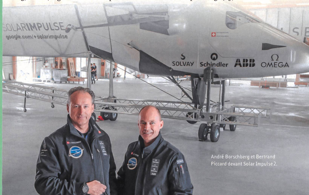
André Borschberg et Bertrand Piccard devant Solar Impulse 2.

Au cours des onze étapes prévues pour ce tour du monde, l'avion devrait se déplacer à une vitesse comprise entre 36 km/h au-dessus de la mer et 140 km/h à 8500 m d'altitude. Il est possible de suivre l'évolution de ce tour du monde sur le site internet www.solarimpulse.org . (luf)