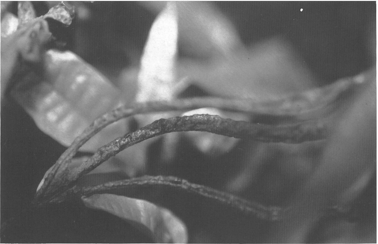
Abb. 1. Von Thysanopteren befallene Pflanze des Wasserfarns Microsorium pteropus (BLUME) COPELAND mit einigen eingerollten Blättern.