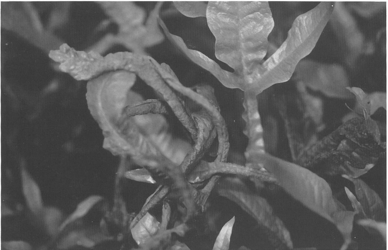
Abb. 2. Röhrenförmig eingerollte Blätter des Wasserfarns Microsorium pteropus (BLUME) COPELAND.