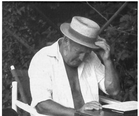
In Soyhières