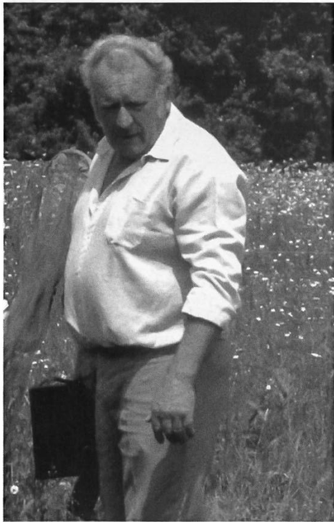
In der Reinacherheide