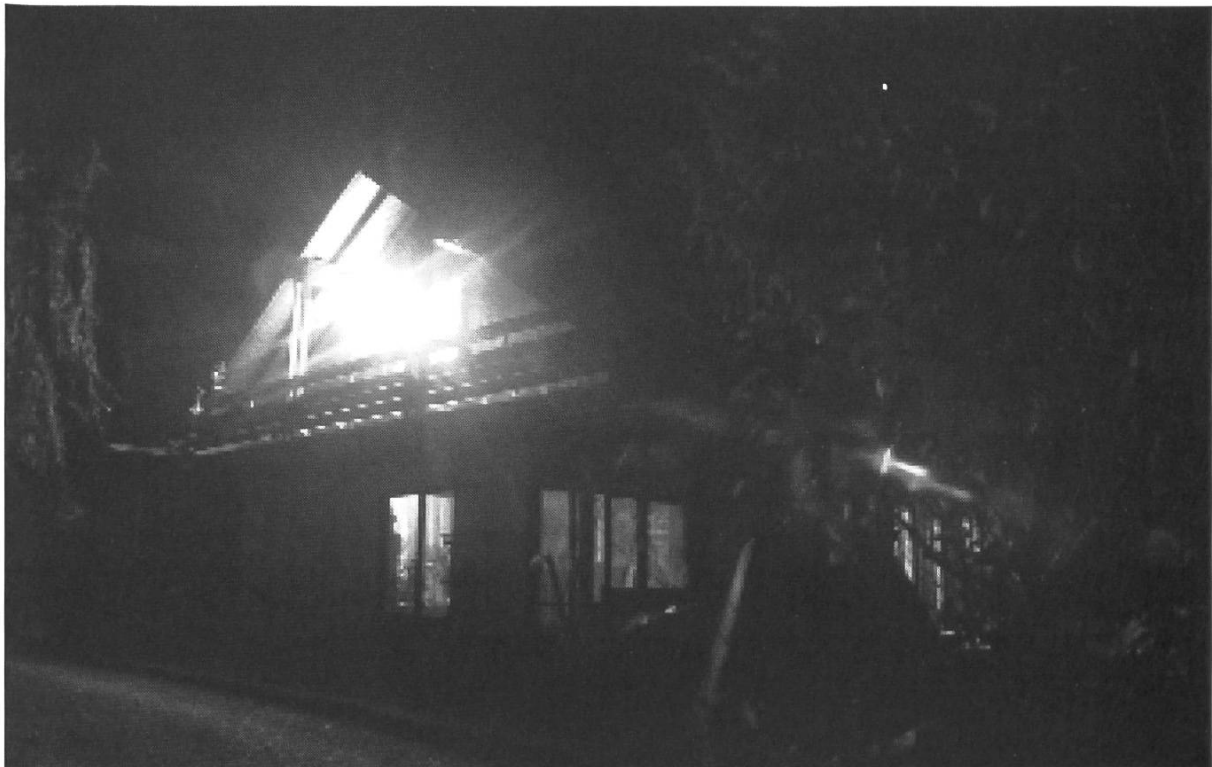
Abb. 4. Die Leuchtanlage an der Westseite des Hauses (Dezember 2002)