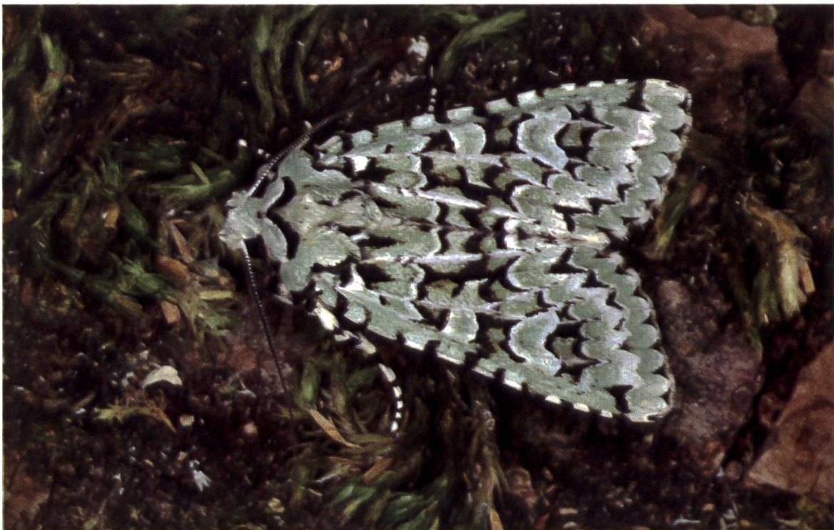
Abb. 9. 9694 Dichonia aprilina (Trauereule), Zunzgen, Hardstrasse