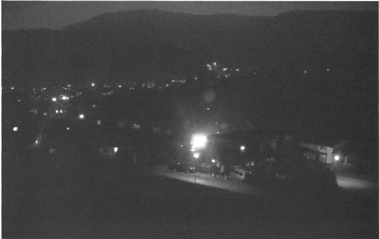
Abb. 3. Die eingeschaltete Leuchtanlage von Westen her betrachtet (Dezember 2002).