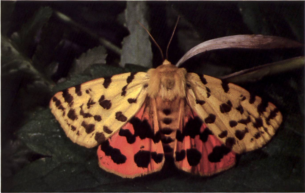
Abb. 8. 10579 Rhyparia purpurata (Purpurbär), Zunzgen, Hardstrasse, am 31.05.2003.