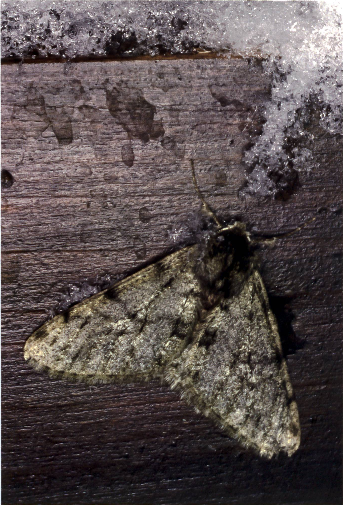
Abb. 7. 7672 Apocheima pilosaria (Schneespanner), Zunzgen, Hardstrasse, am 22.02.2004.