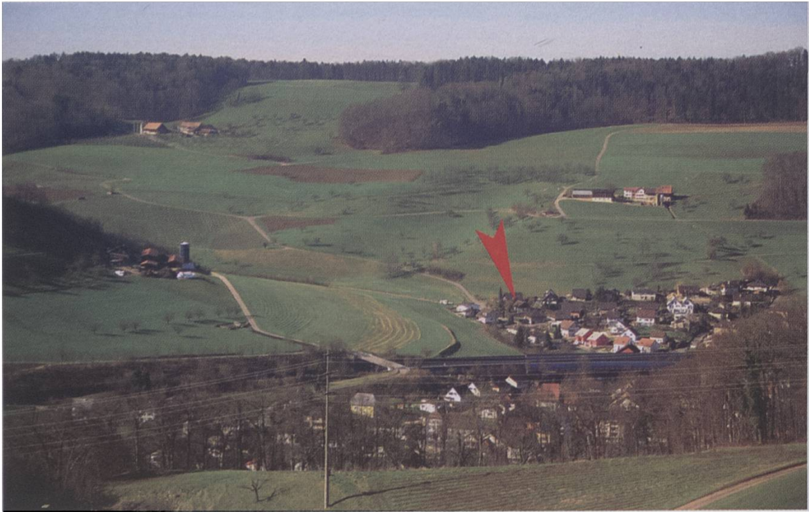
Abb. 1. Blick von der östlichen Talseite auf den westlichen Dorfteil Nästel sowie das angrenzende Landwirtschaftsgebiet (Foto W. Huber).