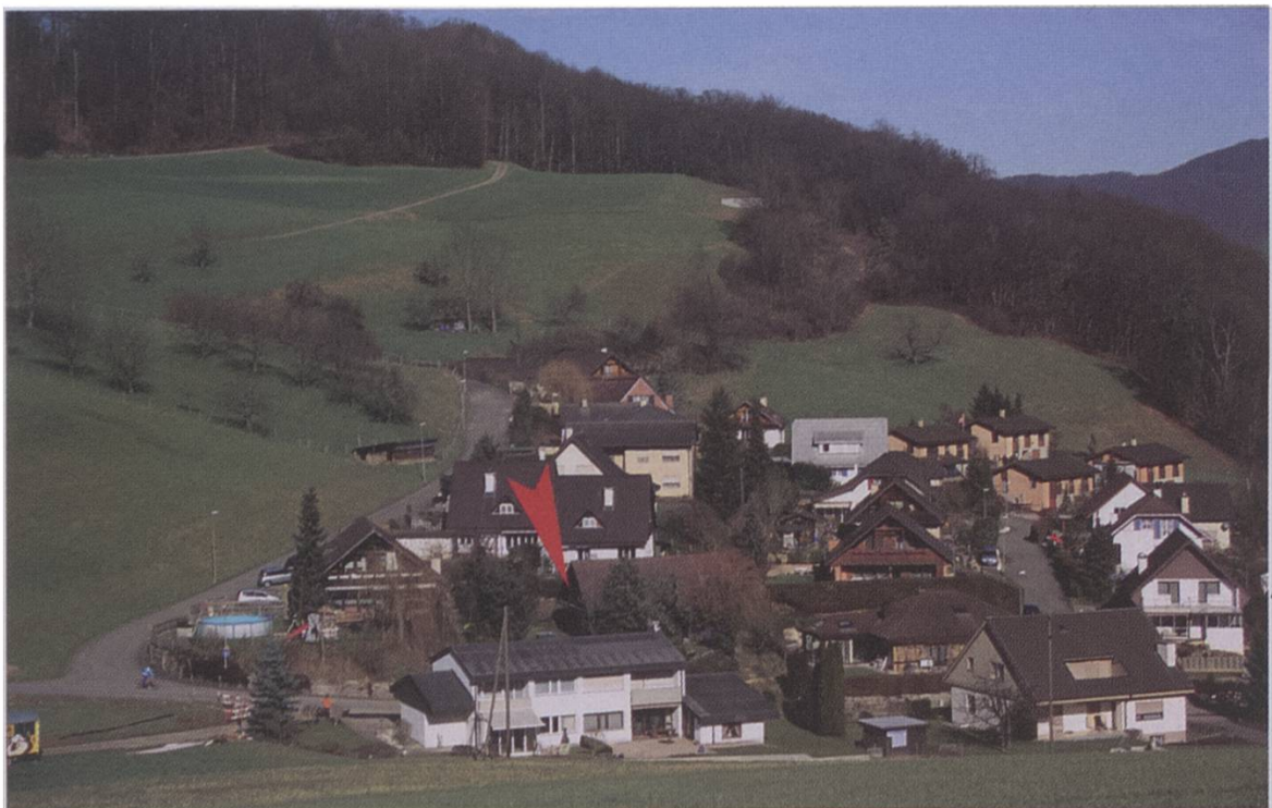
Abb. 2. Der Dorfteil Nästel von Süden her betrachtet