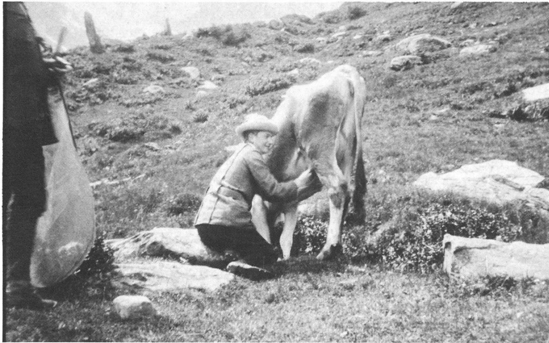
Rossboden: Verdier dans l'exercice de ses fonctions