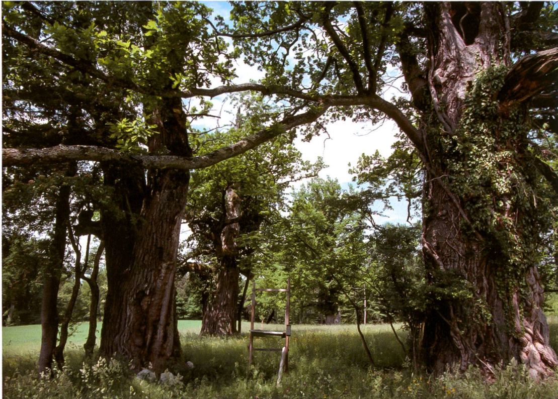
Fig. 1: Site de capture de Dicrostolis falcinervis , Naturschutzgebiet Wildenstein BL, avec le piège-fenêtre placé entre deux très vieux chênes.