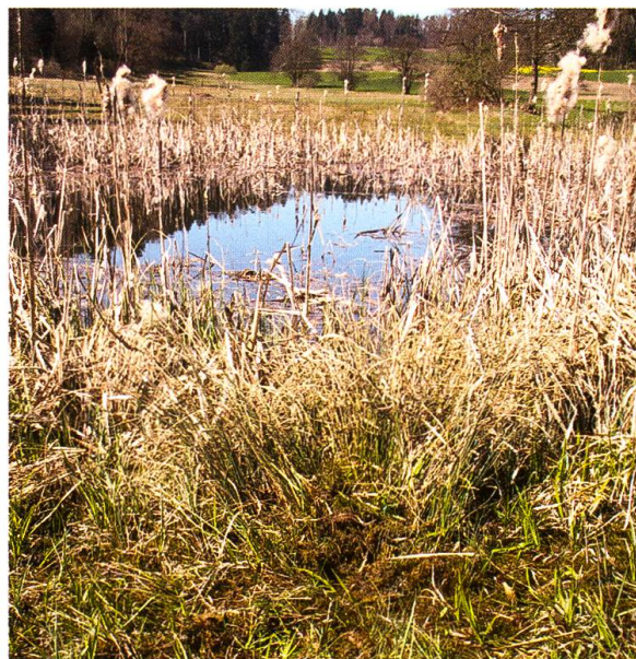
Abb. 3. Fundstelle von Microdon myrmicae (Puppen) in einer gemähten Pfeifengraswiese (Molinion) bei einem mit Röhricht umgebenen Weiher in den Auen (Stäfa, ZH) am 7.4.2011.