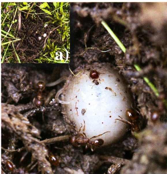
Abb. 2. Myrmekophile Larve der Schwebfliege Microdon myrmicae in einem Nest der Ried-Knotenameise ( Myrmica scabrinodis) in den «Auen» bei Stäfa (ZH) am 23.8.2010. Das Einschubbild (a) des ganzen Nestes zeigt, dass insgesamt mindestens drei solcher Larven vorhanden waren.