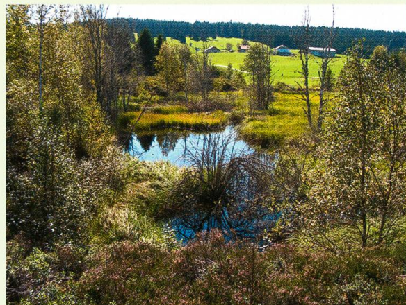
Abb. 6. Im Hochmoor von Les Seignes-Jeanne haben sich durch den Aufstau des Wasser neue Gewässer gebildet.