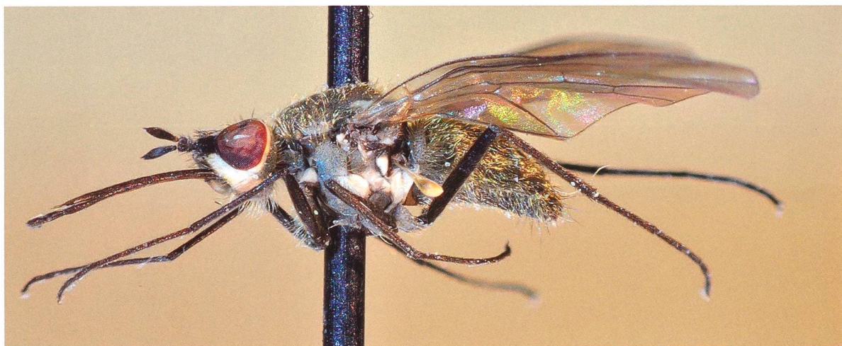
Abb. 2. Dasselbe Weibchen von Phthiria minuta (Fabricius, 1805) von der Seite.