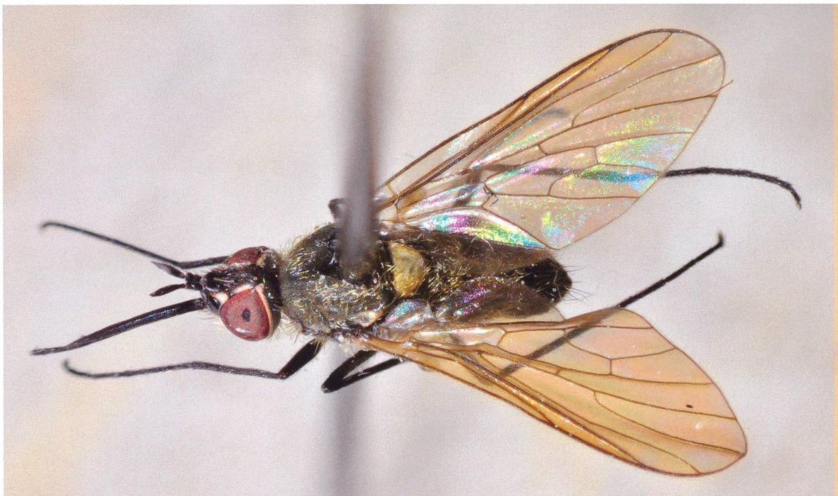
Abb. 1. Das zweite je in der Schweiz festgestellte Weibchen von Phthiria minuta (Fabricius, 1805).

Fabricius hatte P. minuta 1805 aus Frankreich unter dem Gattungsnamen Voluccella Bechstein, 1800 beschrieben. Wiedemann beschrieb die Art 1820 nochmals, jedoch als «österreichische Art» und unter dem heute als Synonym geführten Namen Phthiria maura Wiedemann in Meigen, 1820 (Evenhuis & Greathead 2003).