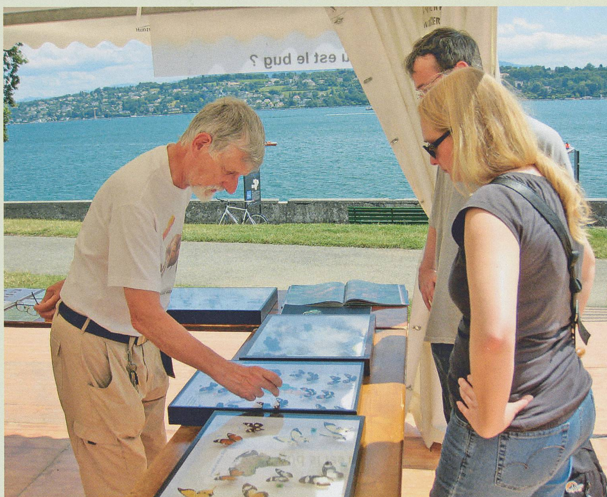
Le stand de la Société entomologique de Genève à la Nuit de la Science.