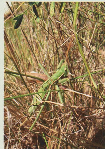
... Phymata crassipes (gauche) et Saga pedo avec Mantis religiosa (droite).