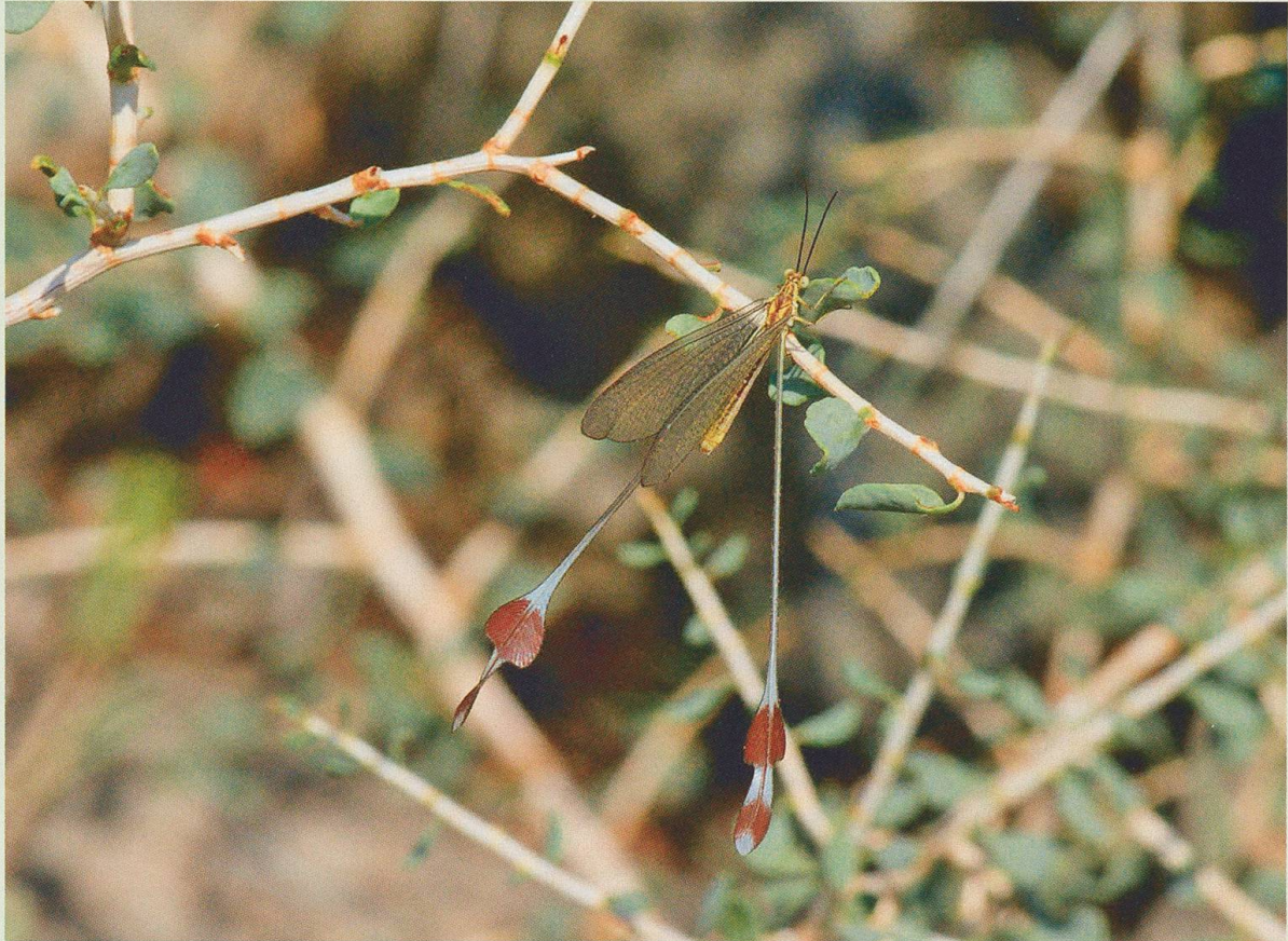
Abb. 1. Eine Vertreterin der Fadenhafte (Nemopteridae) aus Meghri, Armenien, 27. Juni 2011.