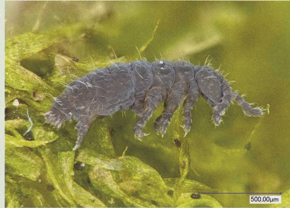
Ceratophysella sigillata