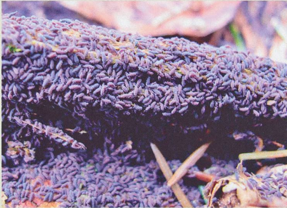
Colonie de Ceratophysella sigillata à Oberlindach BE