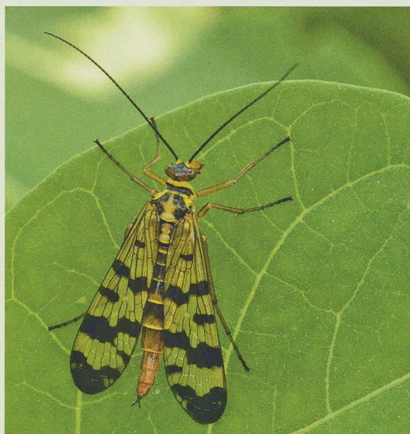
Juin 2012: excursion à travers les prairies et pelouses sèches de Lavaux, sous la conduite de Jérôme Pellet. 26 espèces de papillons ont été observées ce jour-là, ainsi que d'autres insectes telle cette femelle de panorpe Panorpa vulgaris .