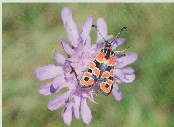
Abb. 1 bis 4: Impressionen der Exkursionen an die Gräte in Merishausen, SH (rechts unten: Zygaena fausta ).