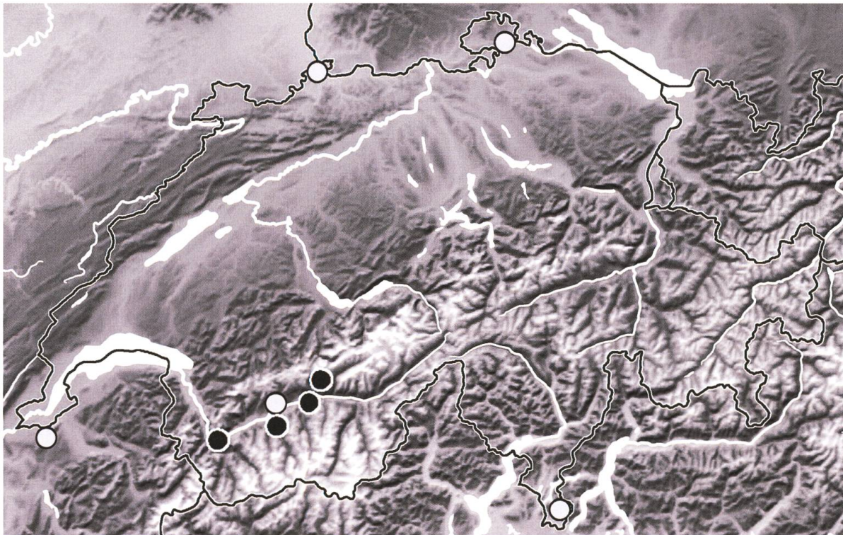
Abb. 2. Karte mit den bisher bekannten Funden von Lixus vilis (Rossi, 1790) aus Germann (2010; weisse Punkte) und die aktuellen Funde für die Schweiz (schwarze Punkte).

Lixus vilis wurde erstmals vertrauenswürdig von Stierlin (1883) aus Mendrisio auf der Wirtspflanze ( Erodium cicutarium ) für die Schweiz gemeldet. Weitere als sicher taxierte Meldungen folgten von Favre (1890) und Stierlin (1898, 1906), jeweils mit Angabe der Wirtspflanze. Germann (2010) fasste alle Meldungen zusammen und erwähnte ein einziges bisher vorliegendes Belegtier der Art aus der unmittelbaren Nähe der Schweiz (Kanton GE) vom Mont Salève in Frankreich. Somit liegt die letzte Meldung durch Stierlin (1906) 109 Jahre zurück.