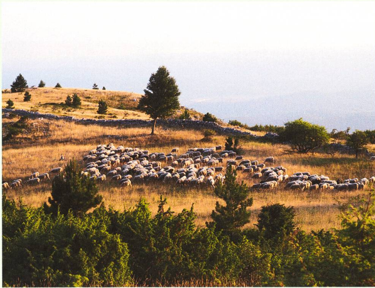
Abb. 3. Extensiv genutzte Weiden mit Büschen, Bäumen und Trockenmauern im Učka-Gebirge sind ideale Lebensräume für Heuschrecken.

zum Beispiel die Garrigue bei Premantura an der Südspitze Istriens oder das Busch- und Weideland bei Svetvinčenat – und der höchsten Erhebung des Učka-Gebirges, dem 1401 m hohen Vojac mit seinen Bergwiesen und Waldlichtungen. Als besonders ergiebig erwiesen sich die landwirtschaftlich extensiv genutzten, teilweise vergandenden Karstlandschaften mit abgeernteten, von Hecken umrandeten Äckern sowie die weitläufigen, savannenartigen Schaf- und