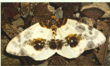
Abraxas sylvata (Scopoli, 1763).