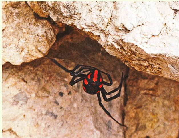
Abb. 10. Älteres Weibchen der Schwarzen Witwe beim Netzbau in einer Felsnische. Ein neuer Faden ist eben an der Gesteinsunterlage angeheftet worden.