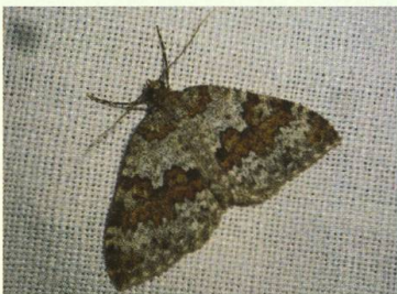
Entephria infidaria (de La Harpe, 1853).