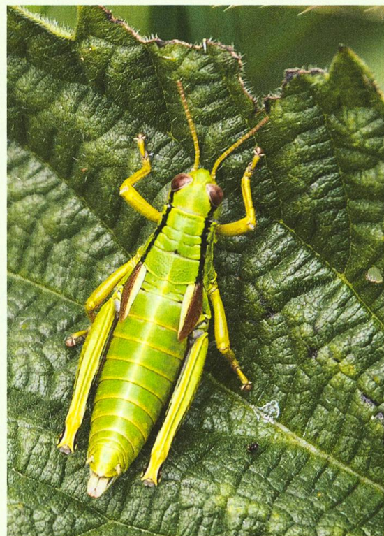
Abb. 2. Trotz trüber Witterung zeigten sich einige Insekten: ein Tandem der Speer-Azurjungfer Coenagrion hastulatum (oben), die Alpine Gebirgsschrecke Miramella alpina (unten).