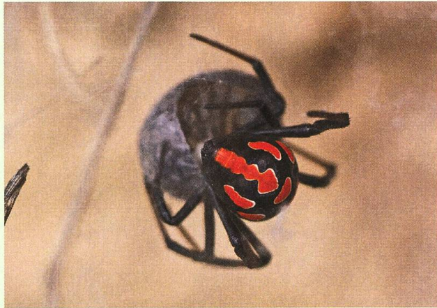
Abb. 9. Junges Weibchen der Schwarzen Witwe Latrodectus tredecimguttatus beim Verzehr einer Rollassel Armadillidium sp.

In der Garrigue bei Premantura ergab sich Gelegenheit, das eindruckliche Paarungsgeschehen der Balkan-Sattelschrecke Ephippiger discoidalis ausgiebig zu verfolgen. Männchen und Weibchen sassen oft auf den Spitzen durrer Büsche, wo sie – zur Thermoregulation die Körperachse der Sonne zugewandt – durch leichte Luftzüge etwas Kühlung erhielten. Von hier aus liessen die Männchen alle 20 Sekunden ihren kurzen, charakteristischen Gesang ertönen, der für uns bis 15 m weit hörbar ist. Fanden die Geschlechter, wohl zusätzlich mit Hilfe von Klopf- und Tastsignalen,