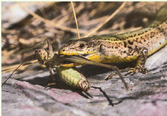
Abb. 6. Adriatische Mauereidechse Podarcis melisellensis mit erbeuteter Beissschrecke Platycleis modesta .