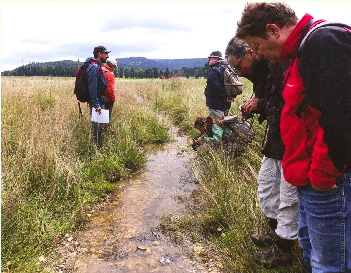
Abb. 1. Auf der ausgedolten Strecke befindet sich die Rouge Eau noch im Pionierzustand. Die Aufmerksamkeit der Teilnehmenden gilt hier den Wasserinsekten.