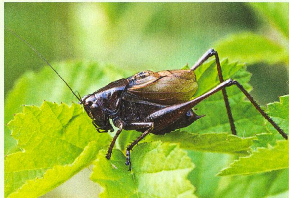
Abb. 7. Ein besonderer Fund im Ljubliana-Moor: die Laubheuschrecke Zeuneriana marmorata .

Saga pedo nicht fehlen, von der wir ein besonders prächtiges braunes Weibchen mit cremefarbener und schwarzer Zeichnung aufstöberten. Mit dieser reichen Ausbeute an Arten liessen sich selbst verwöhnte Heuschreckenkenner wie die beiden Stefans zufriedenstellen.