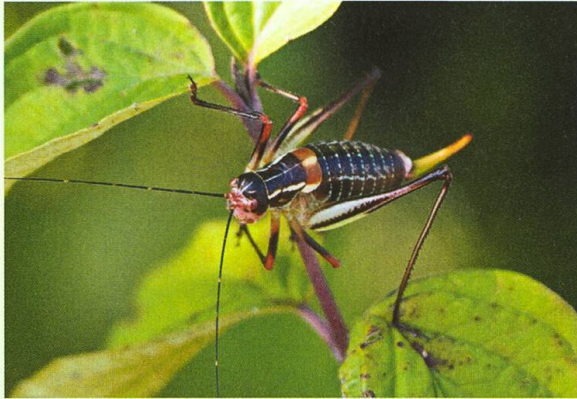
Abb. 4. Die Säbelschrecke Barbitistes ocskayi lebt auf Büschen in lockeren Wäldern und halboffenen Landschaften.