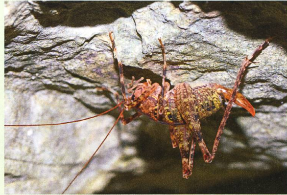
Abb. 5. In feuchten Schluchten und an Höhleneingängen lässt sich nachts die Höhlenschrecke Troglophilus neglectus beobachten.