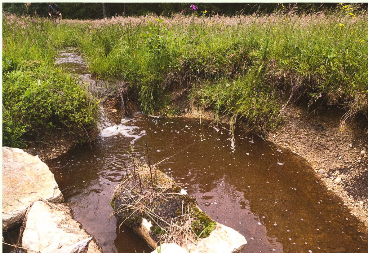
Abb. 3. Eingriffe schaffen auch neue Strukturen. Durch Erosion droht das Gewässer jedoch allzu stark einzutiefen.

aktiv waren, hatte jedoch auch seine positiven Seiten: Die Exkursionsteilnehmer wurden von fliegenden Libellen kaum abgelenkt, sodass sich ein intensiver Austausch über die Aufwertungsprojekte und über die Prognosen zur weiteren Entwicklung des Gebiets anbahnte. Wo wird gemäht, wo ist eine Weidenutzung angezeigt und welches sind die Folgen der unterschiedlichen Nutzungen? Aufgrund des Einstaus des Gewässers schwankt die Abflussmenge nur geringfügig. Trotzdem beginnt der Bach stellenweise zu erodieren, was zu einer rückwärtsschreitenden Eintiefung des Gewässers im untersten Sektor führen kann (Abb. 3).