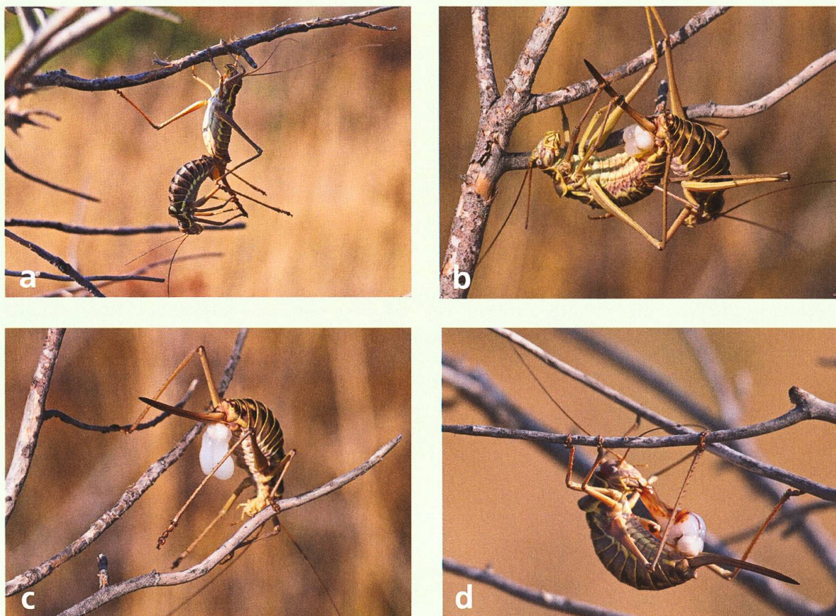
Abb. 11. (a) Balkan-Sattelschrecke Ephippiger discoidalis bei Paarung und beginnender Übertragung der Spermatophore. Die frei hängende Haltung des Männchens ist eher unüblich. (b) Die Spermatophore mit weissem und glasig-durchscheinendem Anteil tritt langsam aus der Geschlechtsöffnung des Männchens und heftet sich am Weibchen an. (c) Kurz nach der Trennung der Paarungspartner werden Grösse und Gestalt der Spermatophore mit Spermatophylax und Ampulle sichtbar. (d) Gleich nach der Paarung beginnt das Weibchen mit dem Verzehr der Spermatophore, die sich durch Verdauungssaft teilweise braun gefärbt hat.

zueinander, stieg das Weibchen auf den Rücken des Männchens, das sich mit den Cerci am Abdomenende der Partnerin ankoppelte und an deren Geschlechtsöffnung im Laufe von wenigen Minuten eine riesige Spermatophore anheftete. Darnach lösten sich die Partner und das Weibchen begann damit, an der Spermatophore zu fressen. Diese besteht aus dem paarigen Spermatophylax, der Eiweisse als Nahrung für das Weibchen enthält und aus der unpaaren Ampulle mit den Spermien, die durch eine Röhre in die Samentasche des Weibchens gelangen.