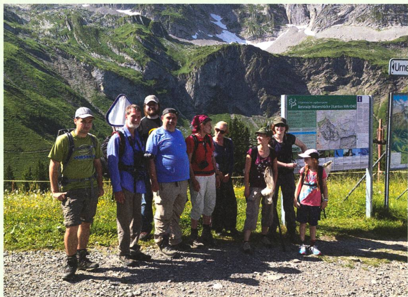
Gruppenbild Teilnehmer EVB Ausflug