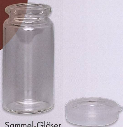
Sammel-Gläser mit Schnappdeckel div. Grössen