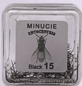
Minutiernadeln für Insekten, schwarz div. Grössen