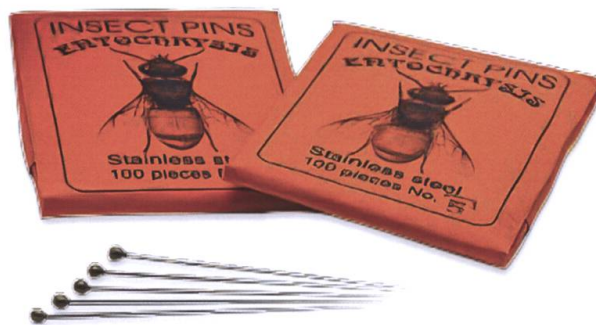
Präparationsnadeln, aus rostfreiem Stahl div. Grössen