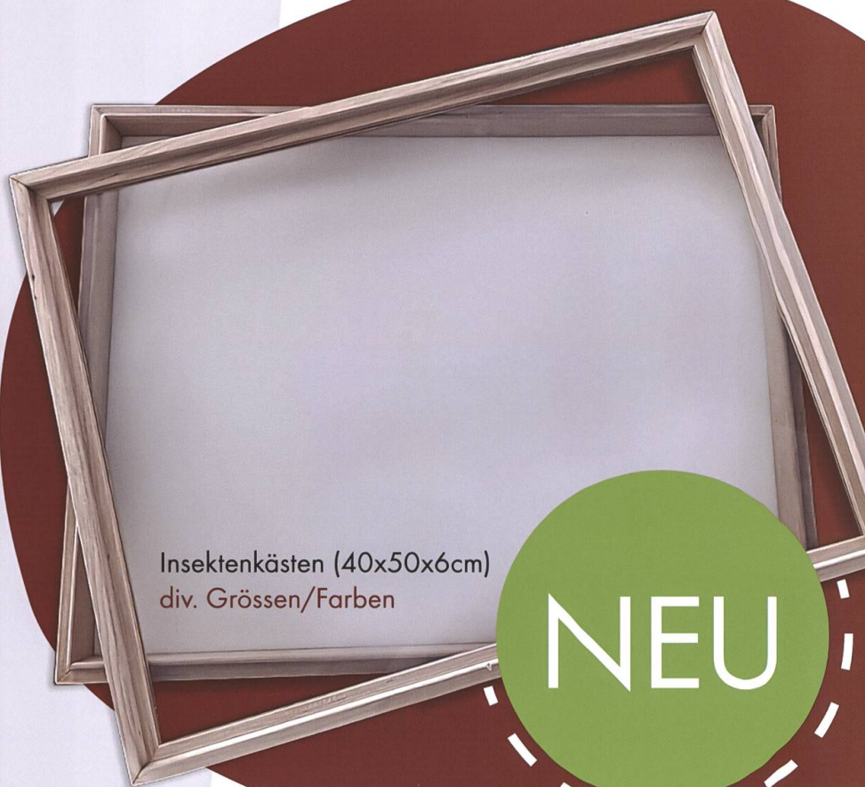
Insektenkästen (40x50x6cm) div. Grössen/Farben