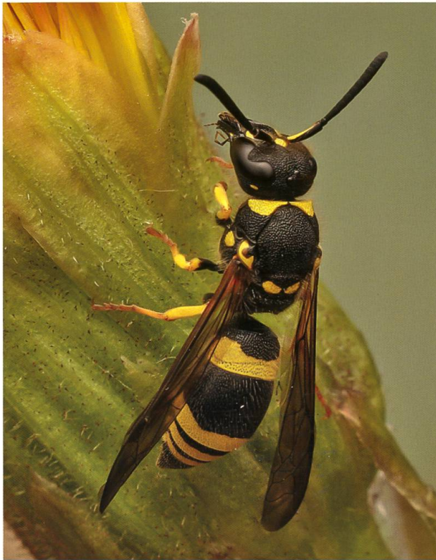
Abb. 1. Ein ♀ der Langdornigen Hakenwespe Ancistrocerus longispinosus (Saussure, 1855), gesammelt von Rainer Neumeyer (leg. et coll.) in einer Trockenwiese bei Ascona (Parolo et al. 2022).

Die zu den Lehmwespen (Hymenoptera: Vespidae, Eumeninae) gehörende Gattung Ancistrocerus Wesmael, 1836 ist in Europa einschliesslich der Kanaren und Madeira mit 25 Arten vertreten (Neumeyer 2019: 245). Die Weibchen der meisten Arten nisten in Pflanzenstängeln, Totholz, Mauerspalt, alten Stechimmenbauten und anderen oberirdischen (epigäischen) Hohlräumen, in welche sie für ihre Larven vorwiegend Raupen von kleineren Schmetterlingen (Lepidoptera) eintragen (Neumeyer 2019), manchmal auch Larven von Blattkäfern (Coleoptera, Chrysomelidae) oder Afterraupen von Blattwespen (Symphyta: Tenthredinidae). Nur wenige Arten wie etwa die Rundbauch-Hakenwespe Ancistrocerus oviventris (Wesmael, 1836) bauen Freinester (Blüthgen 1961: 179 ff., Nielsen 1932: 140 ff.) oder können sogar im Boden nisten (Julliard 1950) wie die Schottische Hakenwespe Ancistrocerus scoticus (Curtis, 1826).