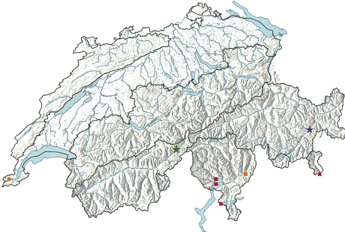
Abb. 2. Verbreitungskarte der Langdornigen Hakenwespe Ancistrocerus longispinosus (Saussure, 1855) in der Schweiz. Die orangen Quadrate bezeichnen Fundbereiche (5 km × 5 km) vor dem Jahr 2000 und die roten Quadrate Fundbereiche ab dem Jahr 2000. Der grüne Stern lokalisiert den Fundort von Münster (VS), der blaue den Fundort von S-chanf (GR). Eingezeichnet sind auch die Grenzen der biogeografischen Regionen nach Gonseth & Sartori (2022).

Regionen «Westliche Zentralalpen» und «Östliche Zentralalpen» (Gonseth & Sartori 2022: 11) vorgestossen ist (Abb. 2), wie die folgenden beiden Funde zeigen: