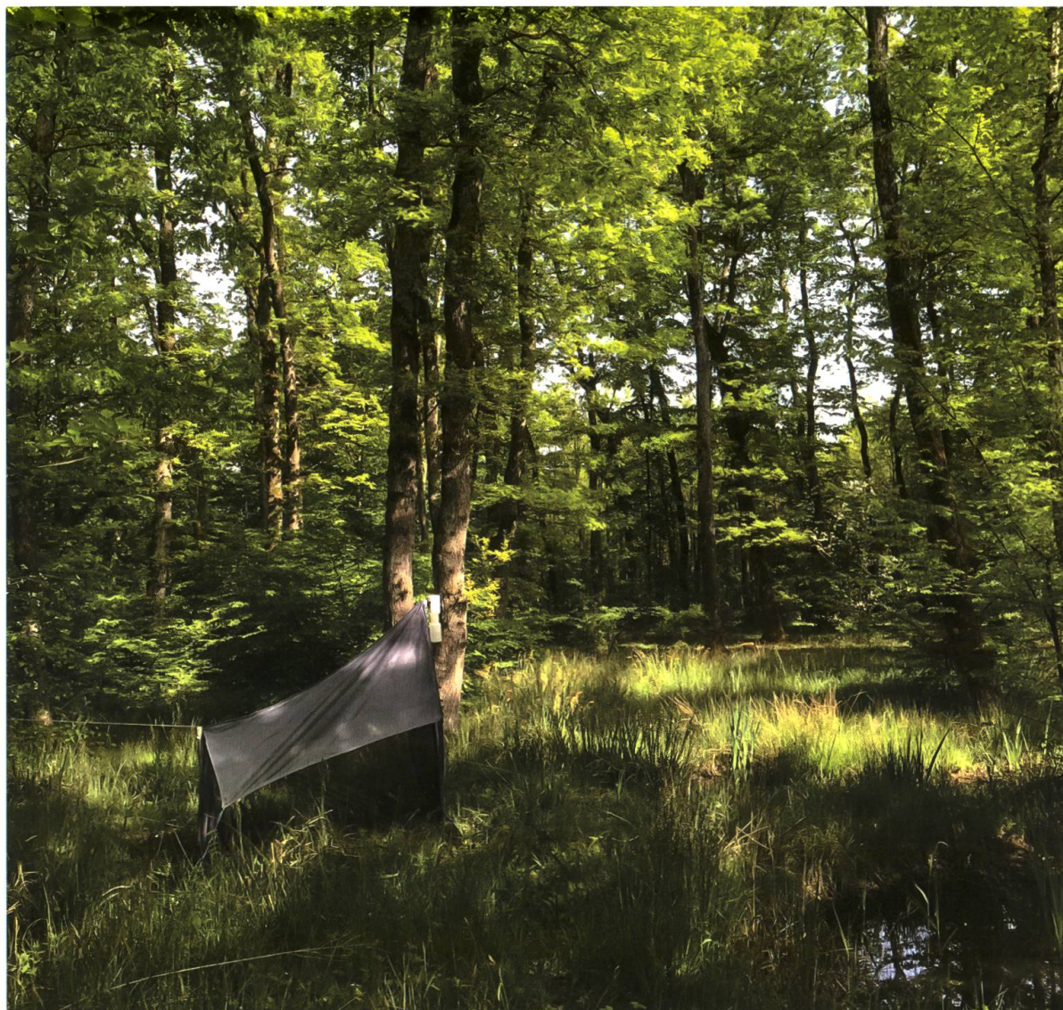
Fig. 1. Piège Malaise situé dans la chênaie à molinie de la réserve naturelle du Bois des Mouilles dans lequel les femelles de Sargus harderseni Mason & Rozkošný, 2008 ont été collectées en juin 2022.

Les deux femelles ont été collectées dans un piège Malaise situé dans la réserve naturelle du Bois des Mouilles (Bernex, canton de Genève, Fig. 1) au mois de juin 2022. Cette réserve est constituée d'un grand plan d'eau colonisé par une roselière, entouré de prairies et d'une chênaie à molinie.