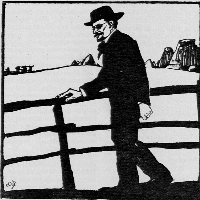
Giovanni Cena, nell'Agro Romano - (Disegno di Duilio Cambellotti)

lastico rurale sempre per delega dello Stato della durata di tre anni.