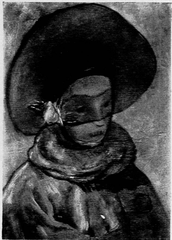
Guido Gonzato - «Cappello rosso».

«Verso il Calvario» rappresenta due teste aureolate: quelle di Gesù e della Vergine accostate. I due volti sono impietriti dal dolore: nessuno spasimo ne turba la piena bellezza fisica. Solo la