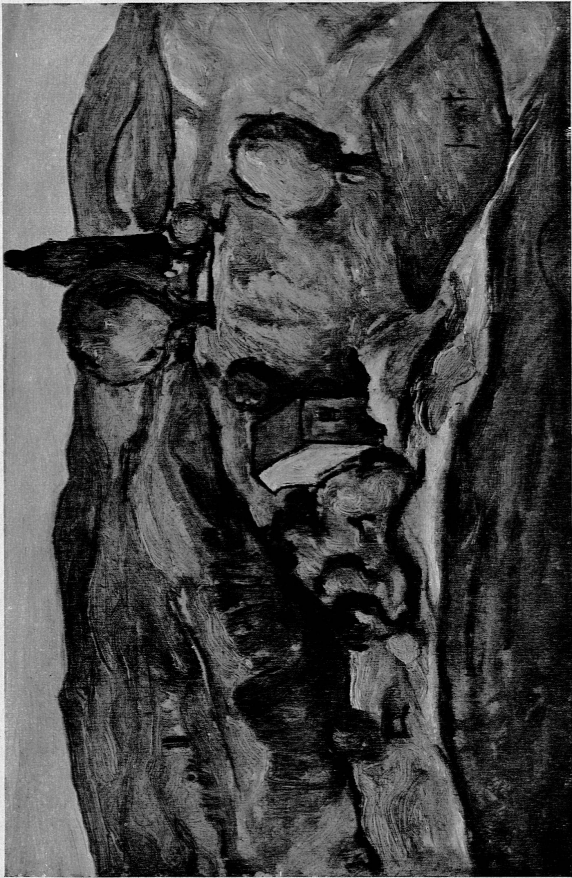
Guido Gonzato - «Sera». 1940