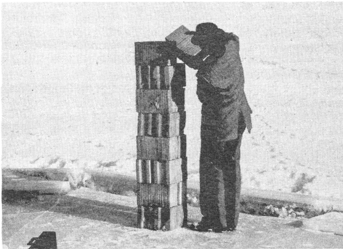
... diese bauen mauern uns davor zu schützen. . .

Eigentlich wollten die Atomindustriellen viel mehr AKW aufstellen, als die bald 500 in aller Welt in Betrieb stehenden Reaktoren. Pierre Lehman hat die AKW-Statistik studiert und feststellt, dass immer weniger AKW gebaut werden. Ist das der Anfang vom Ende der Atomenergie?