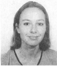
Von Veronica Gurzeler, freie Journalistin in Zürich

Vor einem Jahr gab die Nagra offiziell bekannt, sie werde im Aargauer Mettauertal seismische Messungen für ein Langzeitlager für hochradioaktive Abfälle vornehmen. Die Untersuchungen sind ohne viel Aufhebens über die Bühne gegangen, da sich die Bevölkerung, zur grossen Erleichterung der Nagra, äusserst kooperativ verhalten hat. Wieso bleibt der Widerstand in diesem Landstrich praktisch aus?