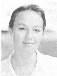
Von Veronica Bonilla Gurzeler, freie Journalistin in Zürich

Stecker einstecken, Schalter anknipsen und schon leuchtet die Lampe. Strom, zu jeder Zeit ausreichend verfügbar, ist heute etwas Selbstverständliches geworden. E&U ist den Drähten hinter der Steckdose nachgegangen, zu Trafostationen und Unterwerken, über Nieder- und Hochspannungsleitungen bis dahin, wo der Strom produziert wird.