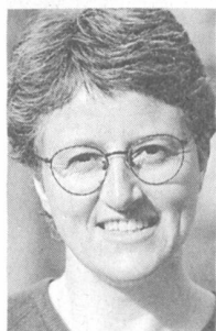
Von Silva Semadeni, SP-Nationalrätin des Kantons Graubünden und Mitglied der nationalen Kommission für Umwelt, Raumplanung und Energie (UREK)

Mit der anstehenden Öffnung des Strommarktes verliert die Schweizer Elektrizitätswirtschaft ihre bisher schützende Monopolstellung. Bei entsprechenden Rahmenbedingungen und einer guten Politik haben Wasserkraft und die übrigen erneuerbaren Energien trotz Liberalisierung eine gute Ausgangslage.