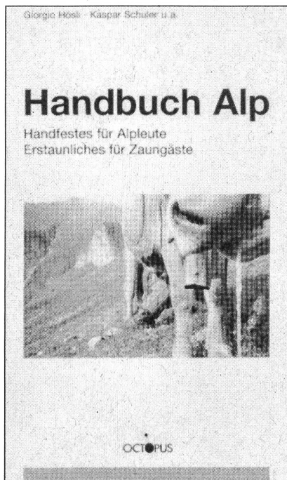
Handbuch Alp Handfestes für Alpleute – Erstaunliches für Zaungäste Giorgio Hösl, Kaspar Schuler u.a. Octopus Verlag 1998; 368 Seiten Preis: 47 Franken

Seit kurzem macht ein aussergewöhnliches Buch still Furore auf dem Schweizer Büchermarkt. Das "Handbuch Alp" ein Nachschlagewerk und Lesebuch für Älplerinnen und Älpler, für Zaungäste und Alp(en)verliebte war in der Erstaufgabe von 1500 Stück bereits nach einem Monat ausverkauft. Die Zweitaufgabe ist jetzt erhältlich.