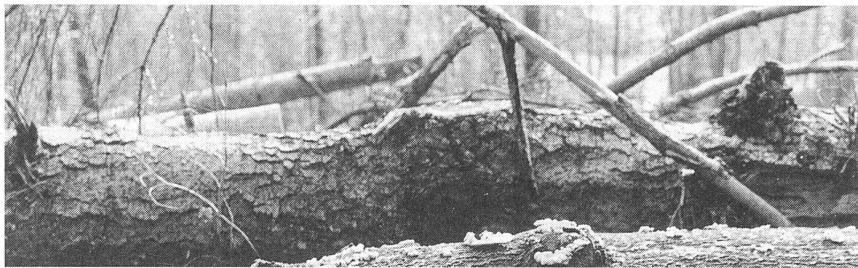
Der Sturm «Lothar» hat allein im Kanton Bern Holz umgeworfen, dessen Energiegehalt dem Vierfachen der jährlichen Produktion des AKW Mühlebergs entspricht.

Ein weiteres Hemmnis besteht im bisher aufwendigeren Planungsprozess von Holzheizungen gegenüber Öl- und Elektroheizungen. Dies ist ein sehr ernst zu nehmendes Problem. Hier haben kantonale Energiefachstellen eine wichtige Führungsaufgabe. Es ist heute nicht mehr sinnvoll, jede einzelne Holzheizungsanlage im Detail auszulegen und bei der Ausführung Mängel zu riskieren. Durch standardisierte Angebote mit klaren Rahmenbedingungen und transparenten Ausschreibungsverfahren (möglichst auf dem Internet) kann der Einzelaufwand massiv reduziert werden. Gleichzeitig führt eine solche Konkurrenz zu billigeren Preisen. Ein kantonaler Förderbeitrag für Kleinanlagen könnte an ein solches offenes Angebotsystem geknüpft werden. Auch die Ausführungskontrolle muss systematisiert und von den Energiefachstellen überwacht werden.