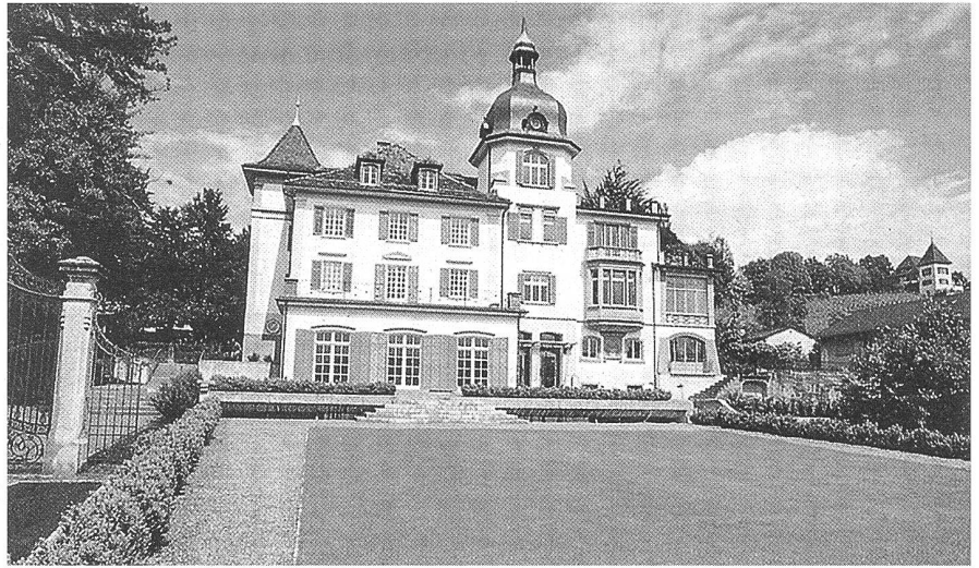
Das Erlengut in Erlenbach, wo das SES-Jubiläum stattfindet.

Möchten Sie einmal mit den heutigen und früheren SES-Leuten fachsimpeln, sich mit ihnen über energie- und umweltpolitische Erfolge freuen oder über skurile Geschichten lachen. Dann sind Sie am Jubiläumsfest der SES am richtigen Ort. Alle Mitglieder und SympathisantInnen sind herzlich willkommen!