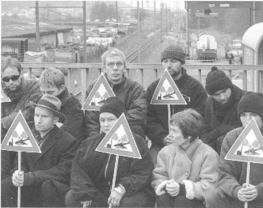
Greenpeace-Demo: Schweizer Atomkraftwerke sind nicht gegen terroristische Flugzeugabstürze geschützt.