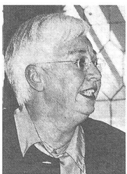
Von Rosmarie Bär, Arbeitsgemeinschaft der Schweizer Hilfswerke

Vor zehn Jahren am Erdgipfel von Rio übernahmen die Industriemächte die Hauptverantwortung für den globalen Kurswechsel. Heute ist die Bilanz ernüchternd. Die rücksichtslose Globalisierungspolitik der 90er Jahre widersprach allen Geboten der Nachhaltigkeit. Die Folgen des massiven Produktions- und Konsumverhaltens vor allem der Industrieländer treffen die Armen des Südens am meisten.