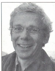
Von Stefan Füglistner*

Es war kalt damals, im April 1975, der Boden gefroren, als die Besetzung begann. Wir waren nicht viele zu Beginn, vielleicht etwas über hundert, weil eben die Schulferien begonnen hatten. Eine gemischte Gesellschaft: Einige Frauen und Männer aus der Region, ein Bäcker, ein Bauer, Lehrer, ein selbständiger Kaufmann, PolitaktivistInnen, PazifistInnen, Junge und auch einige Alte. Eine Besetzerin notierte in ihrem Tagebuch: «Wir sind ein kleiner Haufen von Frauen und Männern, die meisten habe ich auch schon gesehen. Füsse vertreten, Arme schwingen und zwischendurch ein Blick in Richtung Strasse: was mag von dort kommen? Zuerst die Bauarbeiter. Wir werden sie von