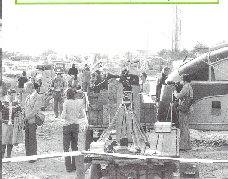
Kameras in Position vor einer Wochenend-Vollversammlung auf dem Gelände