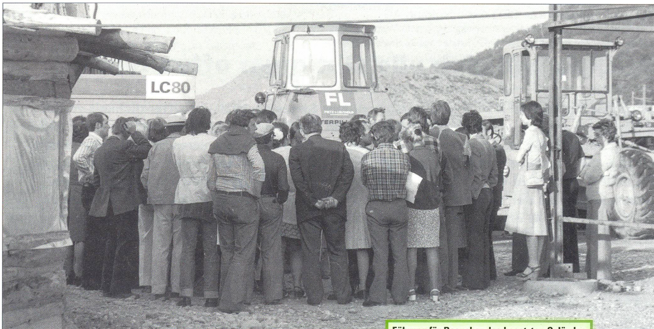
Führung für Besucher des besetzten Geländes

schen Oberexpertisen wurden von der Zeit überholt und viele Forderungen – etwa im Bereich Wiederaufarbeitung und Entsorgung von Atommüll verschärft oder konkretisiert (zu den Forderungen siehe Kästchen «Forderungen der Bürgerinitiativen 1975»).