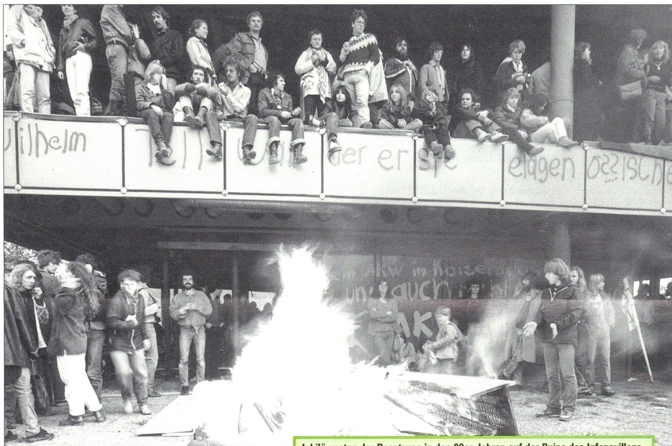
Jubiläumstag der Besetzung in den 80er-Jahren auf der Ruine des Infopavillons.

Daumendicke klebrige Lehmschichten unter den Schuhsohlen, der Mief von feuchten Zelten und Decken, schlafende Kinder an offenen Feuern – es gab Momente in den ersten Tagen, da glichen die Bilder vom besetzten Gelände in Kaiseraugst dem, was man sich unter einem Flüchtlingslager vorstellte.