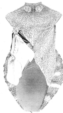
Lederwanze aus Rohr, Kt. Aargau 1995: Linker Deckflügel ist ein kurzer Stümmel. Linke Seite des Scutellums ist geschwellt.