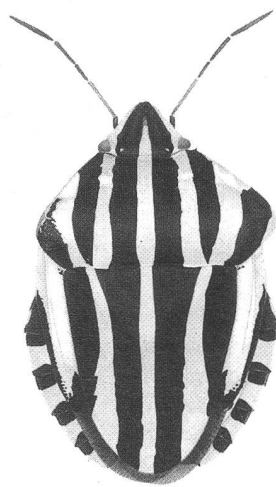
Streifenwanze aus Rohr, Kt. Aargau 1995: abgeflachte Spitze auf der linken Thoraxseite. Das schwarze Muster hat sich der Missbildung angepasst.