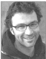
Von Angel Sanchez, Journalist und Fotograf

Mit dem heutigen technischen Stand lassen sich mit Photovoltaik, Warmwasserkollektoren, guter Isolation und Wärmepumpen ökologische Traumhäuser bauen. Damit ist das Limit aber längst nicht erreicht, wie ein Besuch bei der Familie Erni im Kanton Aargau zeigt. Sie produziert auf ihrem Dach mehr Energie, als sie verbraucht.