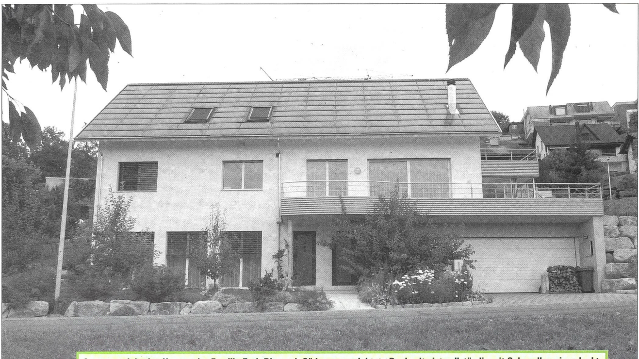
Aussenansicht des Hauses der Familie Erni. Die nach Süden ausgerichtete Dachseite ist vollständig mit Solarzellen eingedeckt.

Auf die ursprünglich geplanten Warmwasserkollektoren hat man anfänglich zu Gunsten einer vollflächigen Photovoltaikanlage verzichtet. Wasserkollektoren hätten im Winter nicht den ganzen Bedarf abdecken können, und im Sommer hätte ein grosser Teil der Wärme nicht genutzt werden können. Die hochwertige elektrische Energie hingegen kann man immer nutzen. Die produzierten 11'000 kWh pro Jahr decken mit der Wärmepumpe den Wärmebedarf des Hauses ab; der Überschuss wird ins öffentliche Stromnetz eingespeist. Die Warmwasserkollektoren werden nun noch nachgerüstet. Eine vergleichbare Solaranlage wie die der Familie Erni kostet heute rund 120'000 Franken.