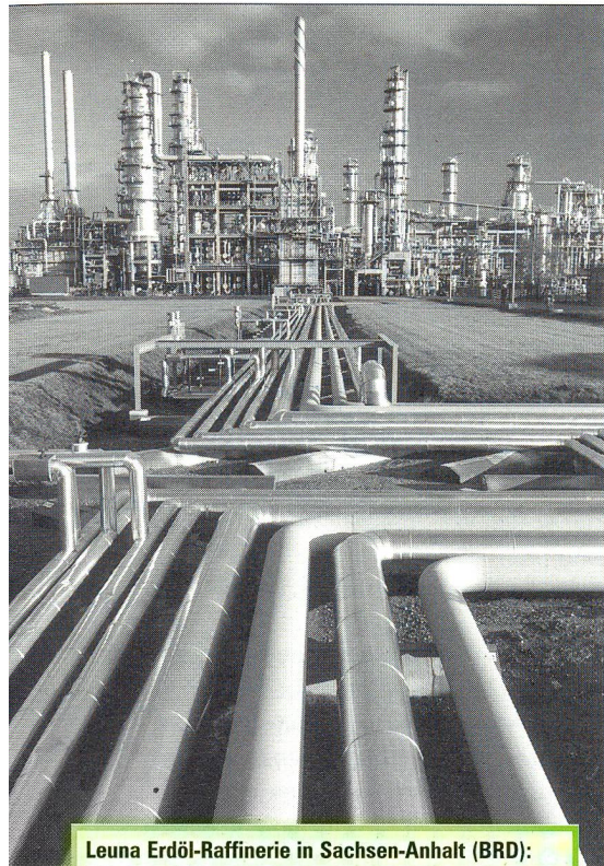
Leuna Erdöl-Raffinerie in Sachsen-Anhalt (BRD): Wie lange fließt das schwarze Gold noch?

mehr unter hohen Rohstoffpreisen als die Industrienationen, dies weil die rohstoffverarbeitenden und energieintensiven Industrien heute in zunehmendem Masse in den Schwellenländern angesiedelt sind. Indien importiert 70% der benötigten Rohstoff-Ressourcen, China 50%.