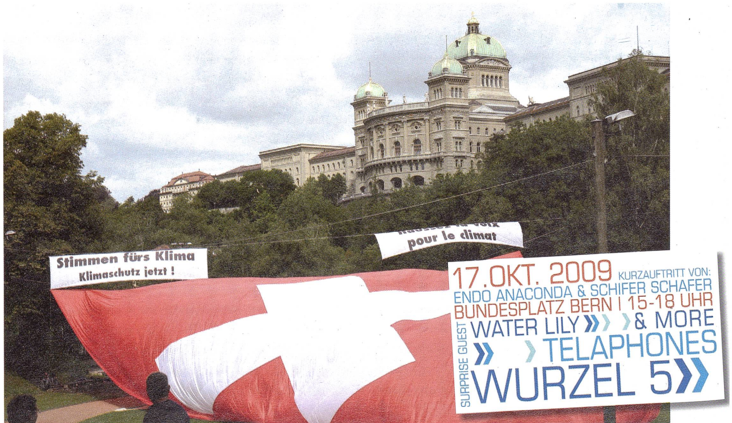
Die Klima-Allianz lädt Sie herzlich zum Klimafest am 17. Oktober 2009 auf dem Bundesplatz ein.

Im Jahr 2008 waren die Schweizer CO 2 -Emissionen mit 40,23 Mio. Tonnen immer noch praktisch gleich hoch wie im Referenzjahr 1990 (40,88 Mio. Tonnen). Im Treibstoffbereich stiegen die CO 2 -Emissionen