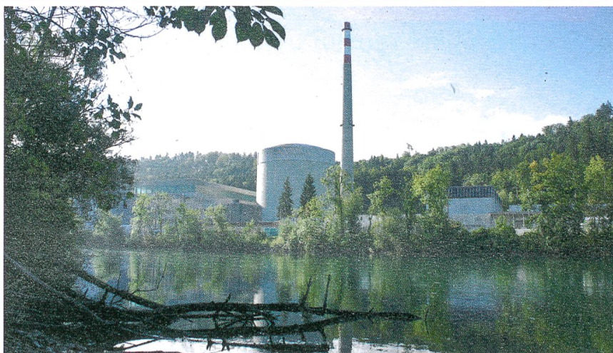
Sicheres AKW Mühleberg? Das Bundesverwaltungsgericht befristete dessen Betrieb bis Juni 2013.

gungen vom 18.3.2011 von den AKW-Betreibern verlangt, die Auslegung bezüglich Erdbeben und Überflutung sowie die gesicherte Kühlwasserversorgung und die Auslegung der Brennelementelagerbecken zu überprüfen. Bereits am 1.4.2011 wurden die Verfügungen noch verfeinert: Bis zum 30.6.2011 mussten die Betreiber zeigen, ob die AKW einer Überflutung standhalten, bis zum 30.11.2011 wie es bezüglich Erdbebenfestigkeit aussieht und bis am 31.3.2012 mussten sie einen Bericht zur Erdbebensicherheit in Kombination mit einer Überflutung einreichen. Pikant: Die Bewertungen zu den Erdbebennachweisen wird das ENSI aber erst Ende Juni 2012 abgeben. Obwohl die Abklärungen nun mehr als ein Jahr laufen und niemand entsprechende Sicherheiten garantieren kann, wurde bisher kein AKW abgeschaltet.