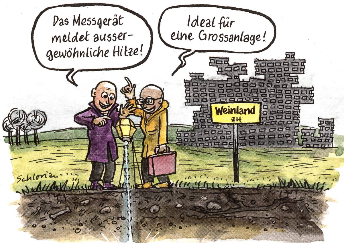
Cartoon: Stefan Haller

Geothermie, 500 Jahre nach Erstellung des atomaren Tiefenlagers