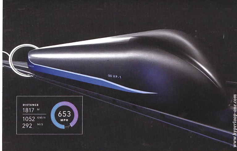
«hyperloop one» – ein Mobilitätskonzept, das einst mit Höchstgeschwindigkeiten von bis zu 1000 Stundenkilometern Personen und Waren energieeffizient transportieren soll. Die Röhren des Bahnsystems könnten mit Solarpanels bestückt werden.