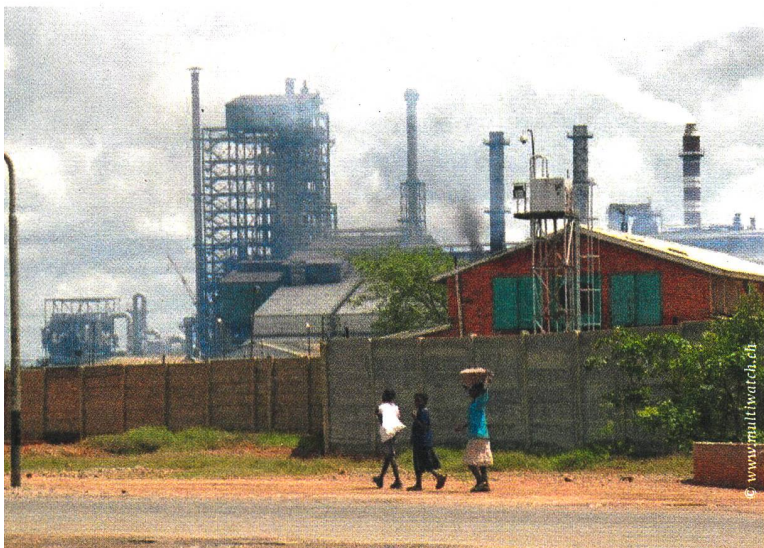
Foto links: Seit fast 20 Jahren vergiftet Glencore die Luft rund um ihre Kupfermine in Mopani, Sambia , mit hoch giftigem Schwefeldioxid, was zu schweren Atemwegserkrankungen und Todesfällen führt. Foto rechts: Glencore betreibt seit Jahren Teile der Kohlemine El Cerrejón in Kolumbien . Für den Tagebau werden lokale Gemeinschaften zwangsumgesiedelt und sie verlieren ihre Lebensgrundlage. Zudem vergiftet die Glencore-Mine den Fluss Ranchería, der rund 450'000 Menschen mit Wasser versorgt, mit Schwermetallen.

Die Manager grosser Konzerne wissen genau, wo ihre Geschäfte mit den Menschenrechten im Konflikt stehen. Doch anstatt auf hoch problematische Geschäfte zu verzichten, werden lieber gutdotierte «Corporate Social Responsibility»-Abteilungen bezahlt. Dabei steht oft die Imagepflege im Zentrum statt dass die wirklichen Probleme gelöst werden. Unternehmensgewinn zählt in manchen Konzernzentralen mehr als der Schutz von Mensch und Umwelt.