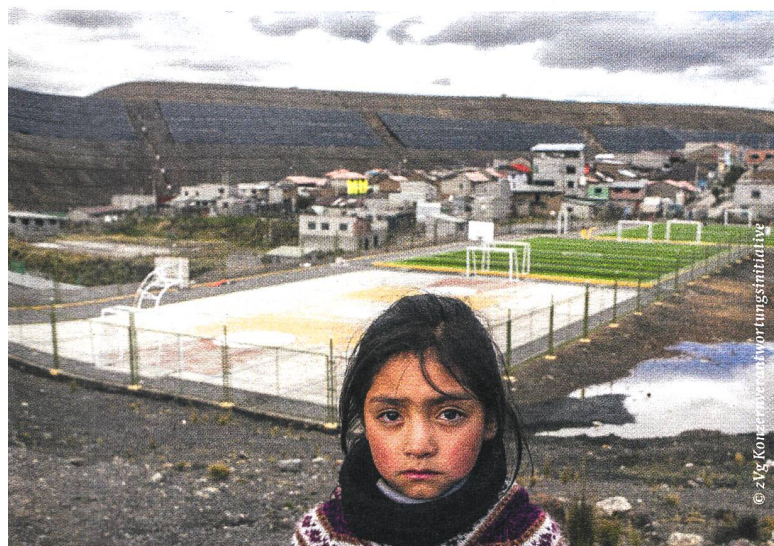
Foto links: Die riesige Glencore-Mine in Cerro de Pasco, Peru , verpestet Luft, Boden, Wasser mit Blei, Arsen und Schwermetallen und führt auch bei Kindern zu Vergiftungen und schweren Erkrankungen. Foto rechts: In Yavatmal, Indien , wurden etwa 800 Landarbeiter beim Ausbringen von Pestiziden auf Baumwollfeldern schwer vergiftet. Zwanzig Menschen sind gestorben. Mitverantwortlich ist das Insektizid «Polo», welches von Syngenta exportiert wird.

Doch im Sommer 2019 hat sich der Bundesrat nachträglich mit einem zweiten Gegenvorschlag eingebracht. Konzerne sollen nicht für angerichtete Schäden geradestehen müssen, sondern bloss einmal im Jahr einen Bericht über Menschenrechte schreiben – resp. erklären, wieso sie darauf verzichten. Der Ständerat hat sich für diesen Alibi-Gegenvorschlag ausgesprochen. In der Frühlingssession 2020 werden der National- und Ständerat die Diskussion über Initiative und Gegenvorschlag weiterführen. Es ist sehr wahrscheinlich, dass die Abstimmung über die Konzernverantwortungsinitiative im Herbst 2020 stattfinden wird.